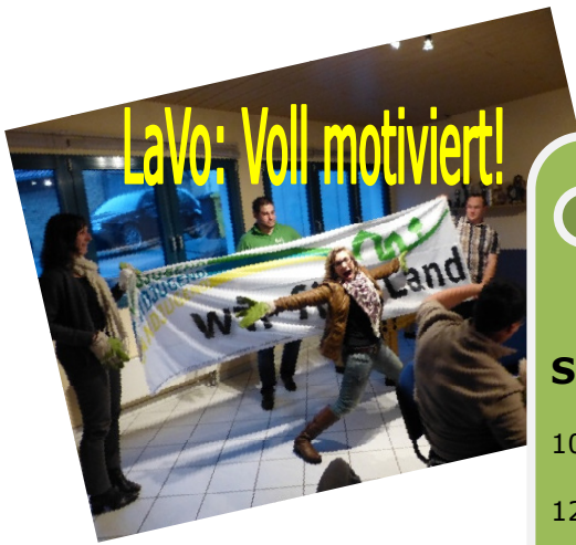
LaVo: Voll motiviert!