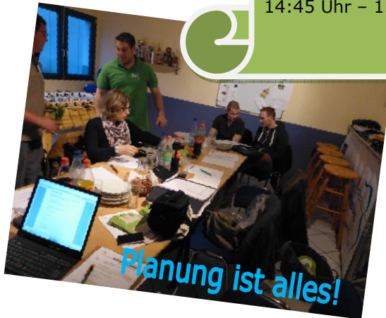
Planung ist alles!