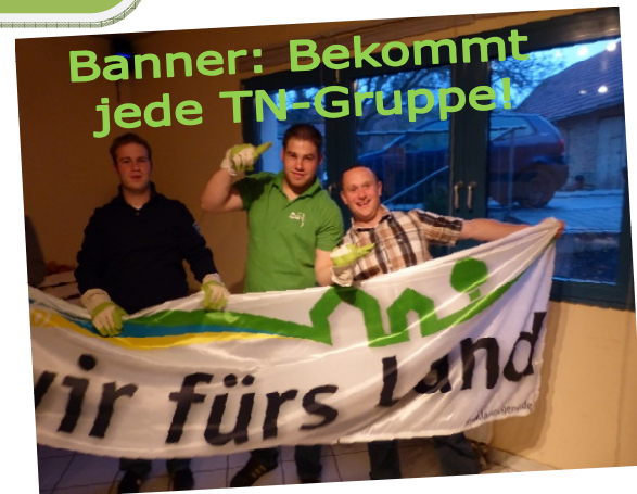
Banner: Bekommt jede TN-Gruppe!