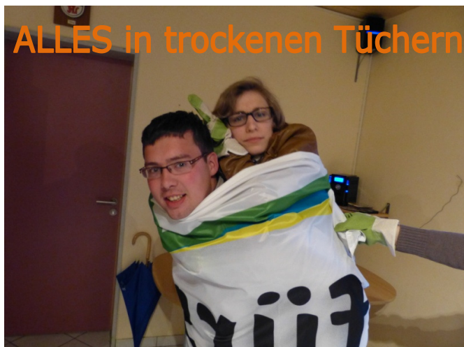
ALLES in trockenen Tüchern

Vorstandssitzung 10.04.2012 "Ich.Du.Wir.Fürs Land"!